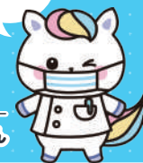
「看護の日」キャラクター かんごちゃん